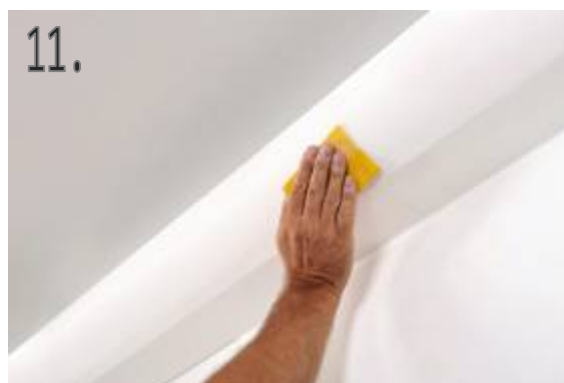
11. Nakonec zahlad'te nerovnosti po lepidle a lištu přetřete bílou akrylátovou barvou.