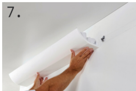
7. Uchycení lišty na stěnu.