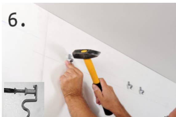
6. Instalace montážních sponek na uchycení lišty.