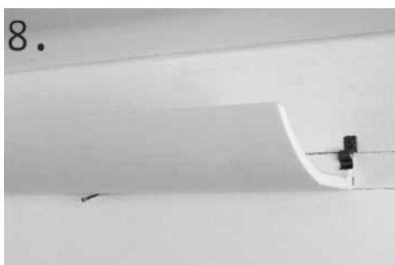
8. Detail uchycení lišty na stěnu.