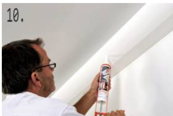
10. Zatmelte spáry mezi lištami lepidlem Adefix Plus.