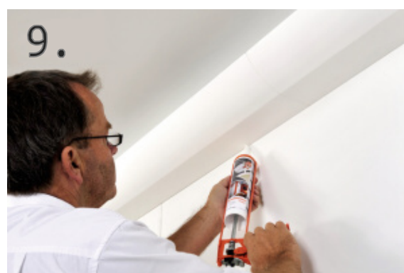
9. Zatmelte spáry lepidlem a řádně lištu zespodu zafixujte.

Umístěte jednu sponku blízko ke hraně lišty a druhou do jejího středu. Naneste lepidlo ADEFIX Plus na lepenou plochu na zadní straně lišty. Nasad'te lištu WT4 na montážní sponky.